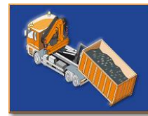
Abroll-/Absetzkipper Behälter und Kräne