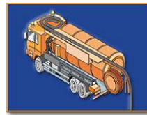
Flüssigabfall- und Rohrreinigungssysteme