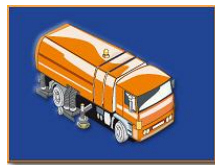
Kehrfahrzeuge u. Geräte